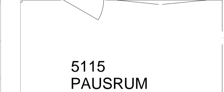
Plan 5 BTA 377