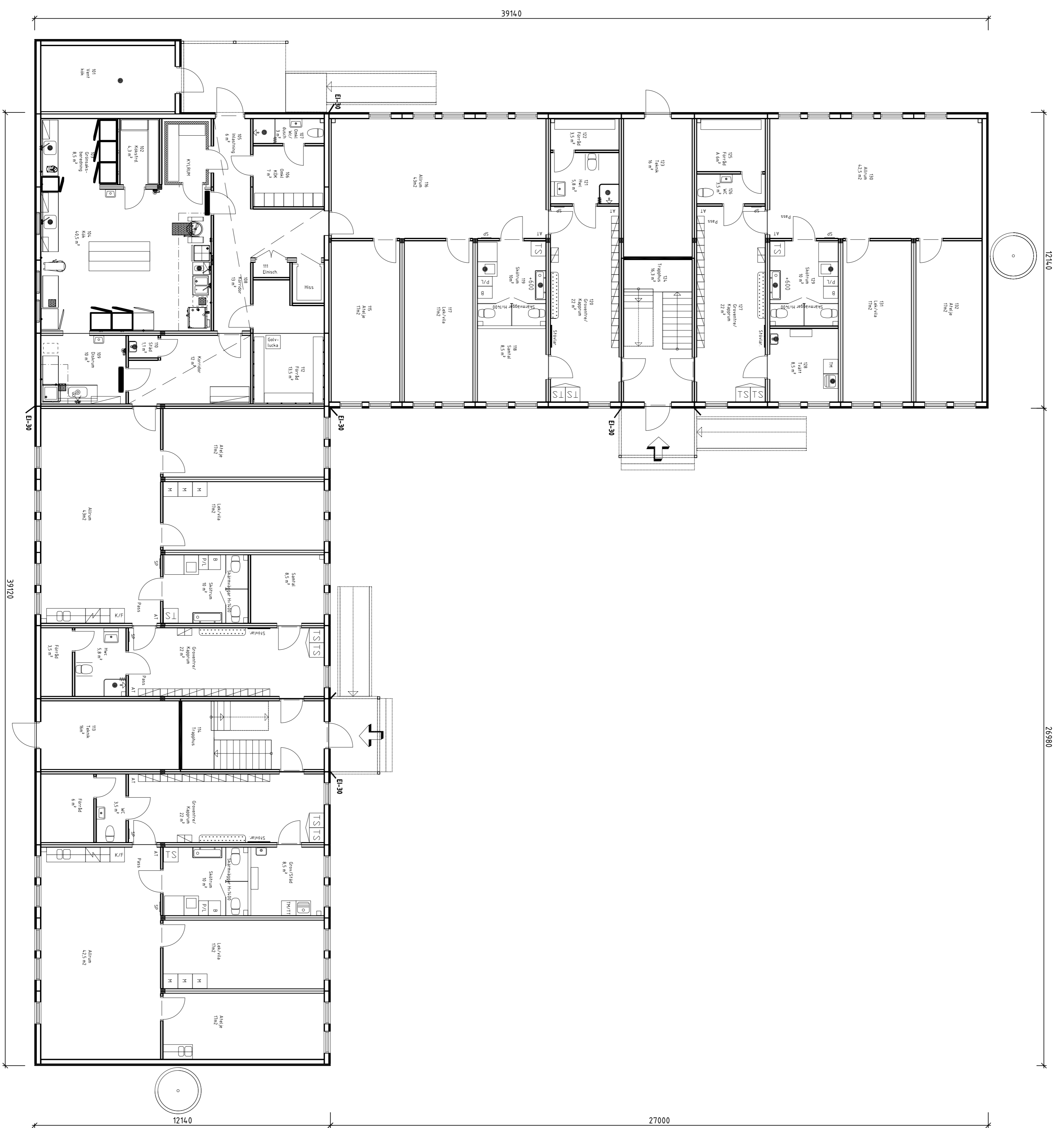
PLAN 1 BTA 783m 2 + Ventrum kok 175m 2